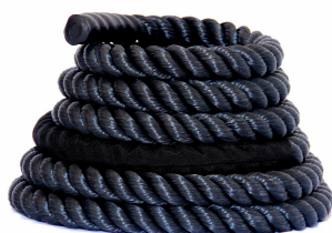
AC-010 Corda Naval 40/50mm Dimensão (mt) 10/12/15