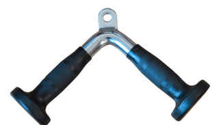
AC-012 Puxador Tríceps Dimensão (mm) 400 Peso 5kg