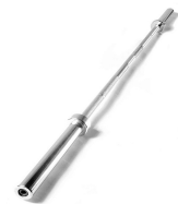
AC-006 Barra Olímpica Dimensão (mm) 1200 Peso 10kg