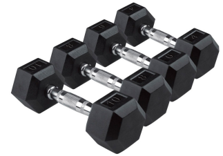
AC-003 Halter Sextavado Disponível 1kg até 10kg