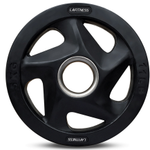
AC-001 Anilha Olímpica Disponível 1,25kg, 2,5kg, 5kg, 10kg, 15kg, 20kg e 25kg