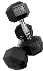
AC-002 Dumbbell Sextavado Disponível 10kg até 70kg