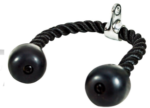
AC-009 Corda Tríceps Dimensão (mm) 600