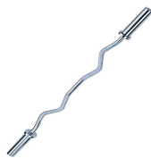
AC-007 Barra Olímpica W Dimensão (mm) 1200 Peso 10kg