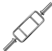
AC-008 Barra Olímpica H Dimensão (mm) 1200 Peso 12kg